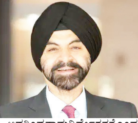
ಅವರಿಂದ ನಾಮನಿರ್ದೇಶನಗೊಂಡ ಡೇವಿಡ್ ಮಲ್ಲಾಸ್ ಅವರಿಂದ ಬಂಗಾ ಅಧಿಕಾರವಹಿಸಿಕೊಳ್ಳಲಿದ್ದಾರೆ. ಅಮೆರಿಕವೇ ವಿಶ್ವ ಬ್ಯಾಂಕ್ ಅಧ್ಯಕ್ಷರನ್ನು ಆಯ್ಕೆ ಮಾಡುತ್ತದೆ.

ವಾಷಿಂಗ್ಟನ್. ಮೇ 4: ಭಾರತ ಮೂಲದ ಅಮೆರಿಕನ್ ಉದ್ಯಮಿ ಅಜಯ್ ಬಂಗಾ ವಿಶ್ವ ಬ್ಯಾಂಕ್ ಅಧ್ಯಕ್ಷರಾಗಿ ನೇಮಕವಾಗಿದ್ದಾರೆ. ಅಮೆರಿಕ ಅಧ್ಯಕ್ಷ ಜೋ ಬೈಡನ್ ನಾಮನಿರ್ದೇಶನ ಮಾಡಿದ್ದಾರೆ.