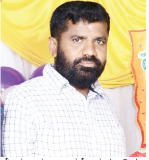
ಧರ್ಮ ತುಂಬುವ ಕೆಲಸ ಮಾಡಿತ್ತು. ಇವೆಲ್ಲವನ್ನು ಮಾಡುವಾಗ ಇವರು ಯಾವ ಪಕ್ಷದವರು ಎಂದು ನೋಡಿರಲಿಲ್ಲ. ಅದಕ್ಕೆ ಹಿಂದು ಧರ್ಮ ವಿರೋಧಿ ಕಾಂಗ್ರೆಸ್ ಪಕ್ಷ ಓಟ್ ಬ್ಯಾಂಕ್ ರಾಜಕಾರಣಕ್ಕಾಗಿ ಮುಸುಕುವುದನ್ನು ಓಲೈಸಿಕೊಳ್ಳುವ ಉದ್ದೇಶದಿಂದ ಬಜರಂಗದಳವನ್ನು ನಿಷೇಧಿಸುವ ಬಳುವಳಿ ನೀಡಲು ಮುಂದಾಗಿದೆ ಎಂದು ಟಿಪ್ಪಣಿಸಿದರು.

ಕಾಂಗ್ರೆಸ್ ಮುಂದಾಗಿರುವುದು ಕಾಂಗ್ರೆಸ್ ಪಕ್ಷದಲ್ಲಿನ ಹಿಂದುಗಳು ಮಾಡುತ್ತಿರುವ ಧರ್ಮ ದೋಷ ಎಂದರು. ಕೇವಲ ಓಟ್ ಬ್ಯಾಂಕ್ ಗಾಗಿ ಹಿಂದು ಮತದ ತುಷ್ಟೀಕರಣ ಮಾಡುವ ಕಾಂಗ್ರೆಸ್ ಪಕ್ಷ ಕೇಂದ್ರ ಬಿಡಬಿ ಸರ್ಕಾರ ಪಿ.ಎಂ.ಐ.ಎ. ಸಂಘಟನೆ ನಿಷೇಧಿಸಿದಾಗ ಮೌನವಾಗಿತ್ತು. ಆದ್ದರಿಂದ ಕಾಂಗ್ರೆಸ್ ಪಕ್ಷದ ಅಭ್ಯರ್ಥಿಗಳನ್ನು ಸೋಲಿಸಿ ಬಿಡಬಿ ಪಕ್ಷದ ಅಭ್ಯರ್ಥಿಗಳನ್ನು ಬಹುಮತದಿಂದ ಗೆಲಿಸಿ, ಗೋಹತ್ಯಾ ನಿಷೇಧ ಕಾನೂನು, ಮತಾಂತರ ನಿಷೇಧ ಕಾನೂನುಗಳನ್ನು ಗಟ್ಟಿ ಮಾಡುವಂತೆ ಹಾಗೂ ಕೂಡಲೆ ಸಮಾನ ನಾಗರಿಕ ಸಂಹಿತೆಯ ಜಾರಿಗೆ ತರುವಂತೆ ಮಾಡಲು ಹಿಂದುಗಳು ಮತ್ತು ದೇಶಭಕ್ತರು, ಸಂಕಲ್ಪ ಮಾಡಬೇಕು ಎಂದು ಒತ್ತಾಯಿಸಿದರು.